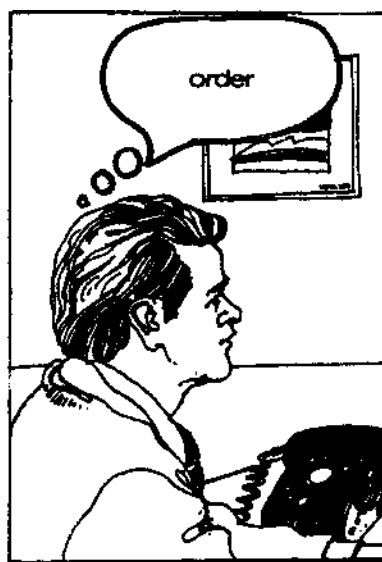
'The order is placed by the customer.'